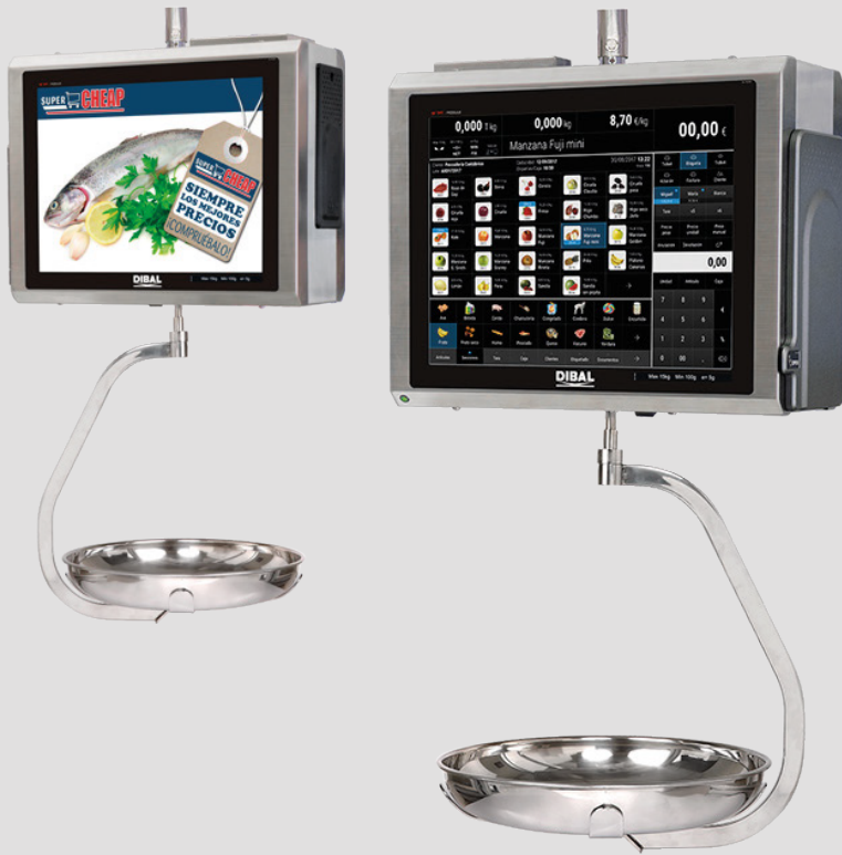
Imagen exclusiva de carácter ilustrativo