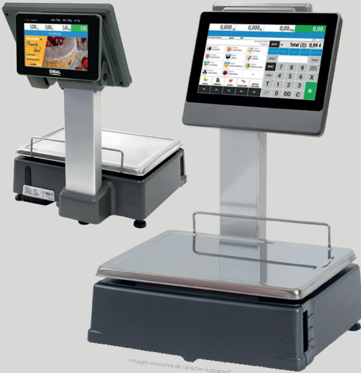
Imagen exclusiva de carácter ilustrativo*