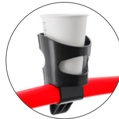
Porta-bebidas universal Universal drink holder