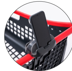
Portamóviles Mobile phone holder