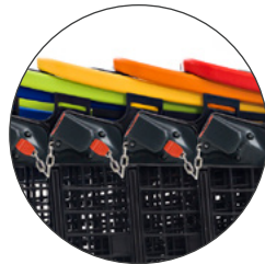
Cadena inicio Starter chain