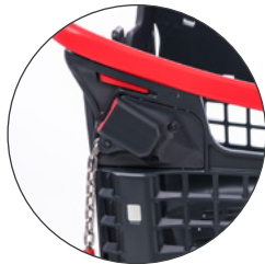
Monedero adaptado Adapted coin lock